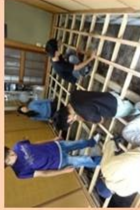
◎ 空き家改修・開放後